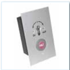
Schlüsseltaster KT 9 AP / UP, Dreifachimpuls Auf-0-Zu mit Taster Halt