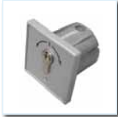
Schlüsseltaster KT 8 UP, (Zweifachimpuls Auf-0-Zu) unter Putz