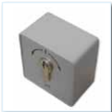
Schlüsseltaster KT 8 AP, (Zweifachimpuls Auf-0-Zu) auf Putz