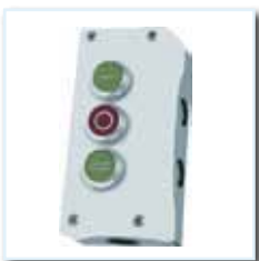
Drucktaster KM 3, AP, dreifach