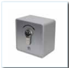
Schlüsseltaster KT 3-1 AP ( Einfach - Impuls ) auf Putz