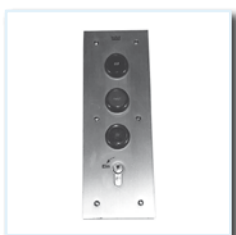
Schlüsseltaster KT 7 UP / AP, mit 3 zusätzlichen Tastern, Ein / Aus Schaltung über Profilzylinder