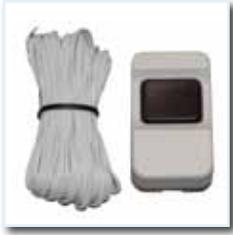
Innendrucktaster einschließlich 5 m Kabel