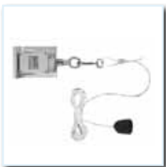
Deckenzugtaster ZT, AP