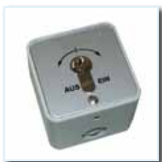
Schlüsselschalter KT 3-2 UP / AP ( Ein / Aus )