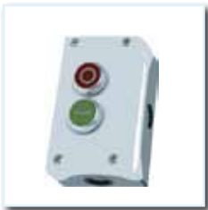
Drucktaster KM 2, AP, zweifach