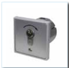
Schlüsseltaster KT 3-1 UP ( Einfach - Impuls ) unter Putz