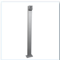
Schlüsseltaster SSS 1, Schlüsseltasterständer komplett mit Schlüsseltaster KT 3-1