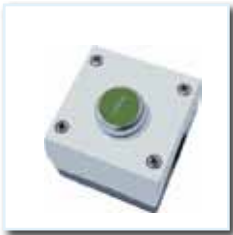
Drucktaster KM 1, AP, einfach